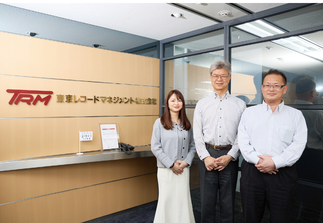
『eValue V 2nd Edition 総合』の全機能を活用して情報管理の精度を高めつつ、顧客への拡販も推進している

東京レコードマネジメント株式会社は、企業が所有する紙や電子の重要な文書に対する管理およびそのコンサルティングを行う情報資産管理の専門企業です。電子文書の管理機能が充実している統合型グループウェア『eValue V 2nd Edition 総合』を導入し、社内の業務効率を高めるワークフローの利用を中心として、社内書類の管理やスケジュール管理、掲示板の利用など、各機能をフル活用している。また、自社の業務改善を進めるだけでなく、販売店として同製品の顧客への販売活動も推し進めている。