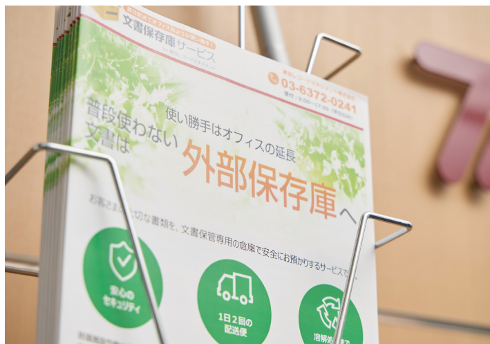
主力サービスの一つ「文書保存庫サービス」。預けた書類が必要になった際は、受け付けから半日で顧客に届けている