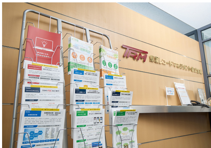
東京・品川区の本社のほか、東京電力の原子力発電所がある福島県と新潟県に支社を持つ

会社設立の経緯により、現在でも東京電力グループの文書管理に関わる作業が業務の7割程度を占めている。しかし、近年は、紙の契約書などを大量に取り扱う不動産業界の展示会に出