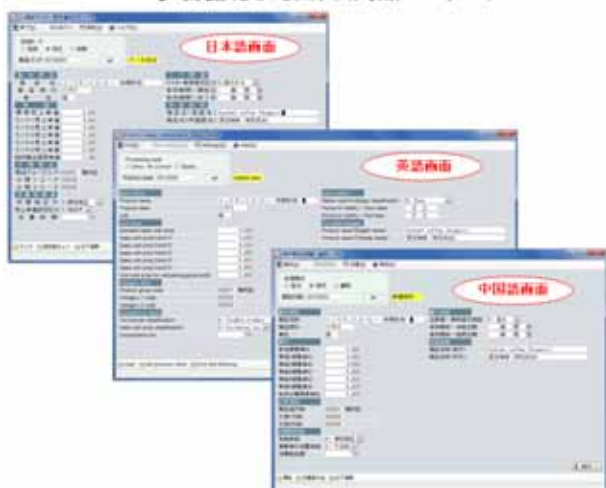
《多言語化した画面(商品マスター)》