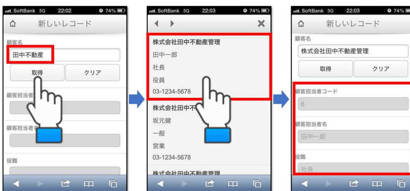
スマートフォン：日報登録「活動内容入力」「部下日報にコメント」